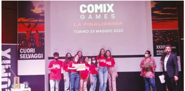
Concorso Vita da Comix