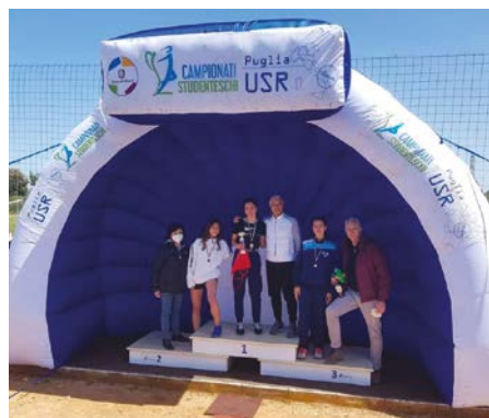
Corsa Campestre - 1° Premio