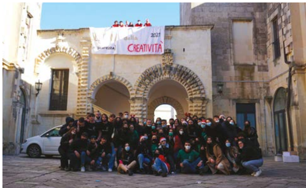
Settimana della Creatività Studentesca