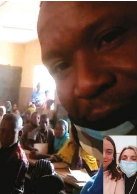
Progetto Internet to Fight the Poverty