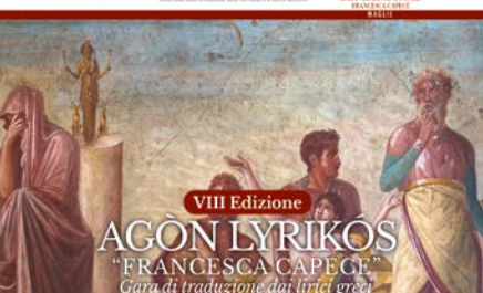
Gara di traduzione poetica dai Lirici Greci