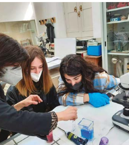
Progetto sulla Cronobiologia