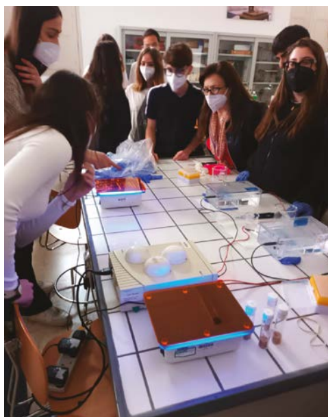
Progetto sulla Cronobiologia Comparata