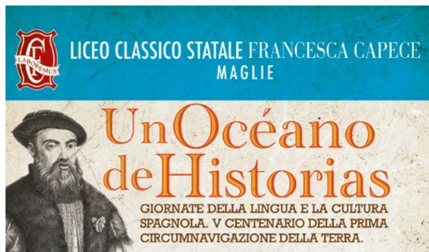
Giornata di Lingua e Cultura Spagnola