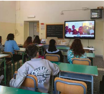
Progetto Internet to Fight the Poverty