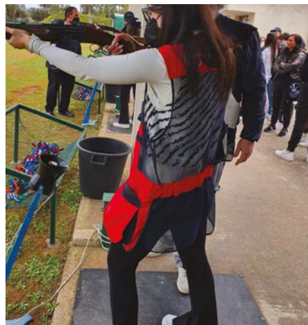
Tiro a volo