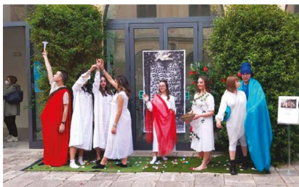
Notte Nazionale del Liceo Classico