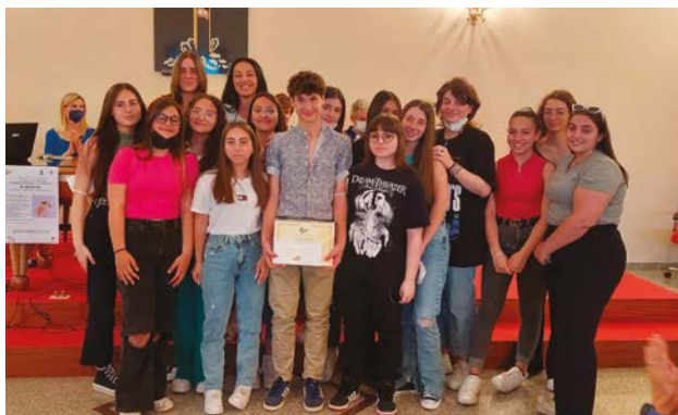
Io Ascolto - Associazione Cif