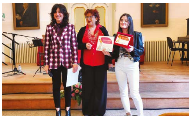
1° Classificato - Olimpiadi regionali di Spagnolo