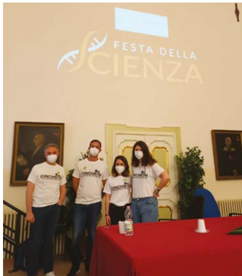
Festa della Scienza