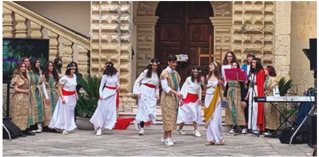
Notte Nazionale del Liceo Classico