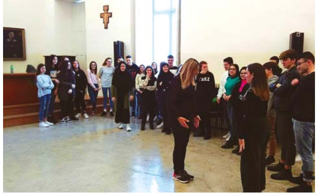
Laboratorio Teatrale in lingua Tedesca