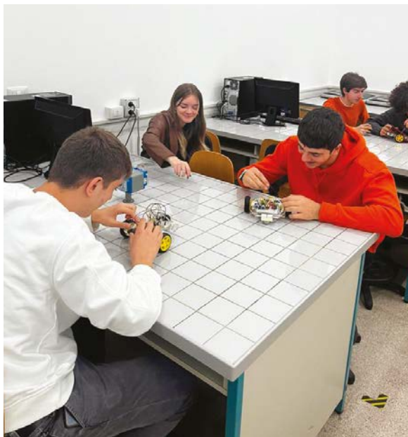
Progetto di Robotica