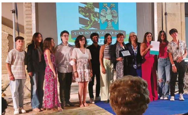
Le Gemme di Maglie