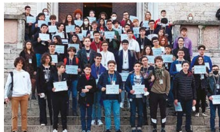
Olimpiadi Italiane di Astronomia Finale Nazionale