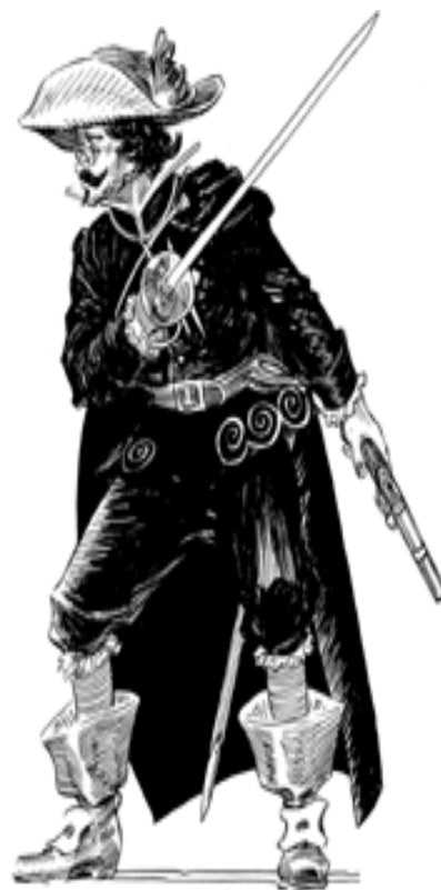
Francisco de Quevedo